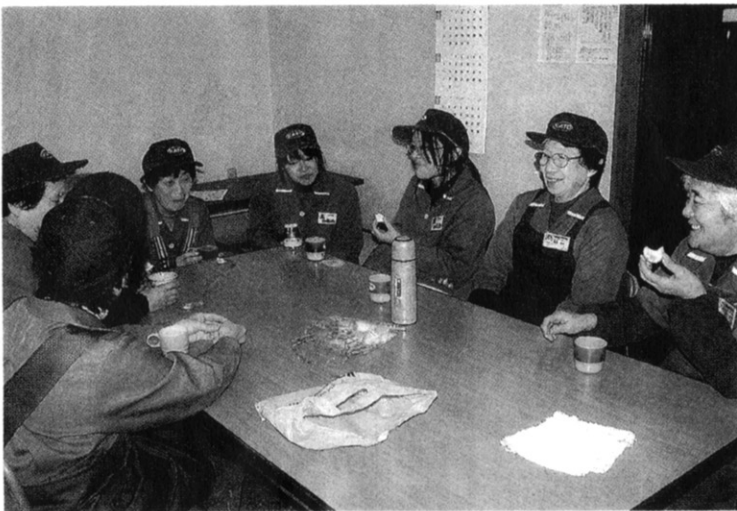
高齢者と若手が一緒に休憩室でくつろぐ。食べ物や健康の話で盛り上がるという同

イ」を合言葉に、週末に働く高齢者を採用。ほぼ一年中の稼働を達成した。経済環境の悪化に伴い、現在は平日のみ稼働となっているが、それでも従業員100人中、51人が60歳以上で最高齢は82歳。受賞は、高齢者の生きがいや